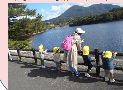
11月園外保育：野岳湖へ行きました。秋を肌で感じ、みな良い表情でした。

秋祭り クラス毎にリズム、合奏を披露しました。人前で緊張しながらも泣かずに頑張りました☆