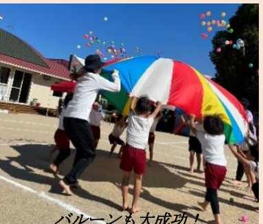
バルーンも大成功！