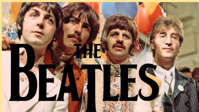
写真: The story behind the beatles "All You Need Is Love"

ビートルズは、当時の差別や偏見など社会問題に対して、歌を通して人々の気持ちを代弁し、ユーモアをもって、平和や愛の重要性を訴えてきました。なぜ、ビートルズが世界中で愛され、また時代が変わった今でもなお愛され続けるのか、それは、人間の普遍的な価値の代弁者だったからかもしれません。