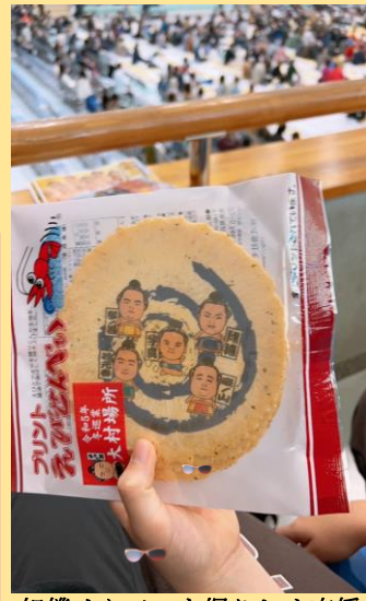
相撲せんべいを握りしめ応援！

R5年11月25日 出島ロータリークラブ様主催 レクリエーション大会 出島ロータリークラブ様主催のレクリエーション大会に参加しました。子ども7人職員4人と少ない人数ではありましたが、頭と体を使って優勝目指してゲームに挑みました。緊張した表情も体が触れると共にキラキラした笑顔に！！子どもだけでなく施設対抗のリレーに参加する職員も子どもさながらに必死の走りを見せていました。結果は昨年同様準優勝ではありましたが、悔し涙を見せる子に「〇〇ちゃん凄かったよ」と励ます子どもの姿に引率職員が目にも光るものが・・・オンラインとは違い、対面での交流はとても楽しい時間となりました。