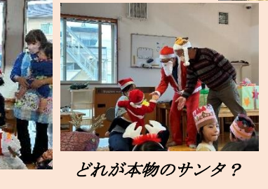
どれが本物のサンタ？