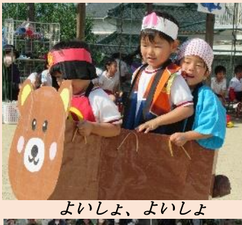
よいしょ、よいしょ