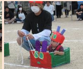
パパと一緒に楽しいな！

10/28(土) 運動会を開催しました。天候に恵まれ、子ども達は最後まで元気いっぱい笑顔で頑張ってくれました。たくさん練習したかけっこやダンス、バルーンもバッチリでした！皆様のご協力のお陰で無事に開催でき、子ども達の最高の笑顔を見ることができました。ありがとうございました。