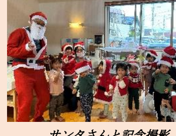
サンタさんと記念撮影

12/15(金) クリスマス会がありました。サンタさんとトナカイさんを探したり、大きなプレゼントを貰ったりと、子ども達は大喜び！最後はサンタさんやトナカイさんも一緒にダンスを踊り、楽しみました♪